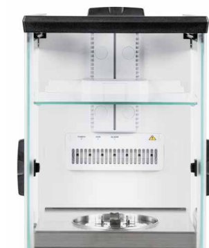
Interner Windschutz – minimiert die Einwirkung von Luftströmen im Wägearaum, nur bei 0,01 mg-Modellen der Serie ABP-A