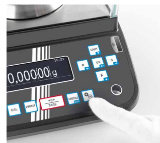
Ionisator (im Lieferumfang enthalten) durch Knopfdruck aktivierbar