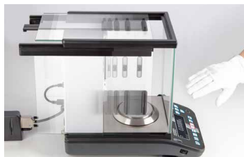
Automatische Schiebetüren – mit Hilfe von Sensoren steuerbar