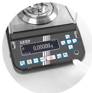
Alternativ Öffnung per Knopfdruck möglich