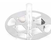
Multifunktionswägeplatte, Hinweis: standardmäßig bei Modellen mit [d] = 0,01 mg