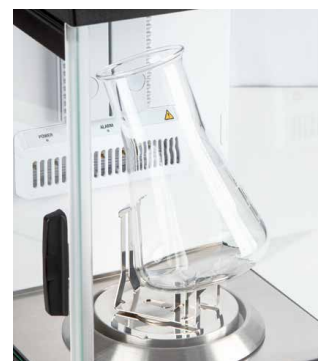
Erlenmeyer-Kolben-Halter, standardmäßig enthalten bei ABP 200-5M und ABP 200-5AM