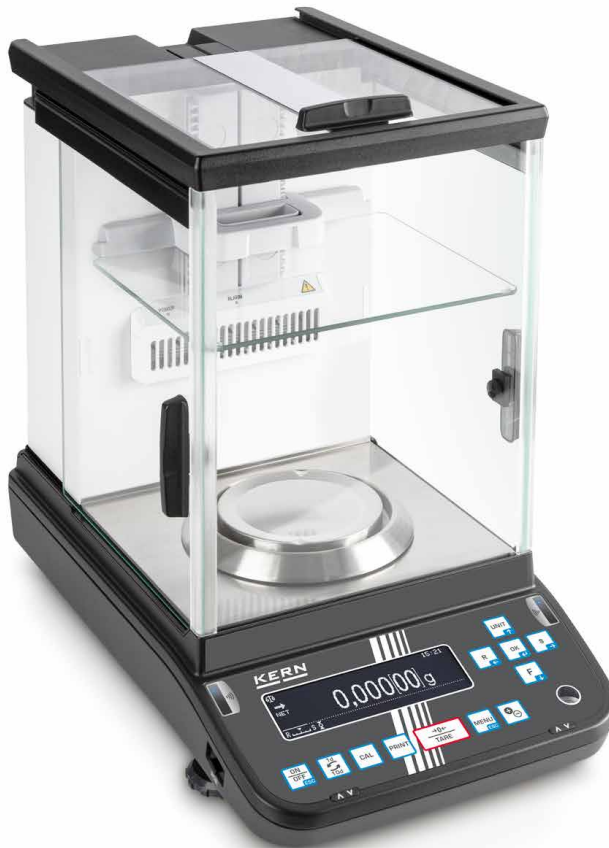
KERN ABP-A con ionizador integrado y parabrisa interno

Posibilidad alternativa de abrirse con pulsar un botón