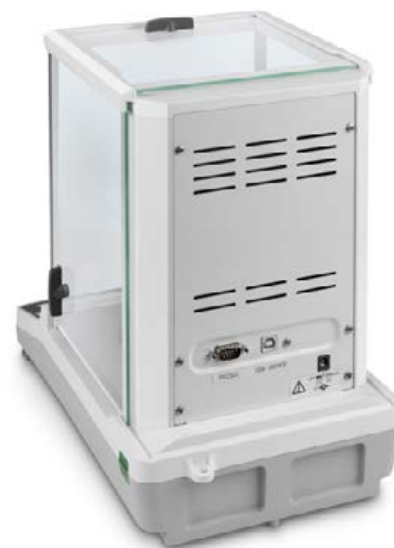
KERN ACS/ACJ mit serienmäßiger Datenschnittstelle RS-232 und USB

Der Bestseller unter den Analysenwaagen, mit hochwertigem Single-Cell Wiegesystem, auch mit Eichzulassung [M]