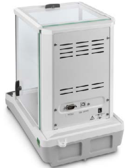
KERN ACS/ACJ avec interface de données standard RS-232 et USB

Le best-seller des balances d'analyse, avec un système de pesage de qualité supérieure Single-Cell, également avec approbation d'homologation [M]