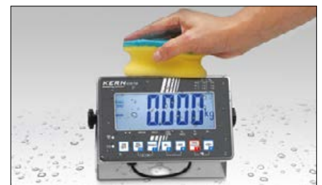
Edelstahl Auswertegerät mit Schutzgrad IP68, hygienisch und leicht zu reinigen