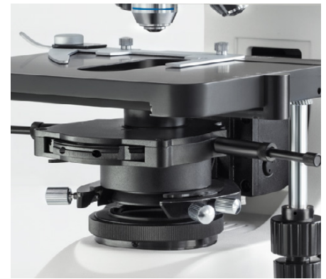
OBN-15: Montierter Phasenkontrastkondensator