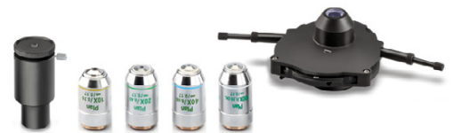
5-fach PH-Universal-Drehkondensator mit 10×/20×/40×/100× Infinity-PH-Plan-Objektiven (Komplett-Set, bei OBN-15 inklusive)