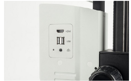
OIV 254 Snapshot-Knopf