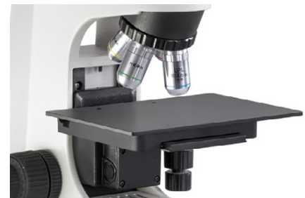
Platina y objetivos