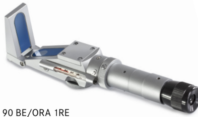
ORA 90 BE/ORA 1RE