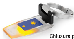
Chiusura prismatica con LED ORA-A1101