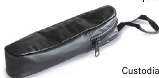
Custodia di fintapelle ORA-A2103