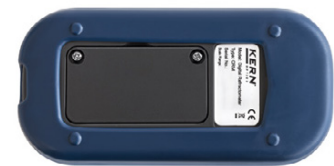
Rückansicht, verschraubter Batteriefachdeckel