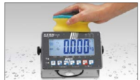
Edelstahlausführung von Auswertegerät und Plattform, dadurch rostfrei und dank glatter Flächen einfach zu reinigen