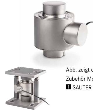
Abb. zeigt optionales Zubehör Montagekit ■ SAUTER CE P41430