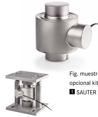
Fig. muestra accesorio opcional kit de montaje ■ SAUTER CE P41430