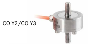
CO Y2/CO Y3