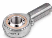
Fig. muestra accesorio opcional SAUTER CE R20, en la tienda de la web encontrará otros accesorios