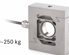
CS P2 50–250 kg