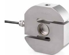
CS P2 0,5–7,5 t