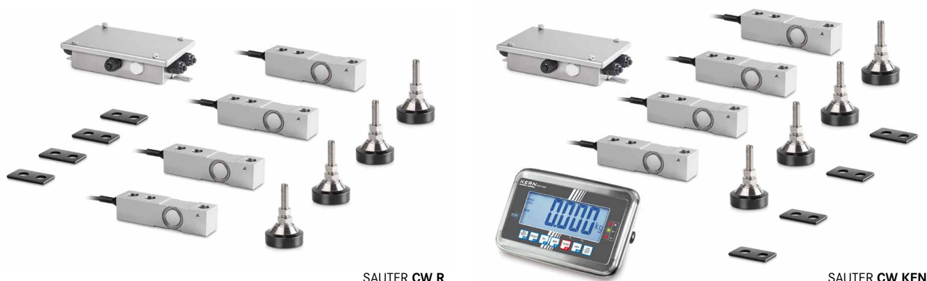
SAUTER CW R