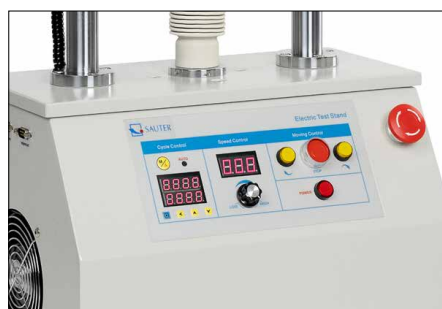
Pannello di controllo Premium - Indicatore digitale di velocità - Funzione digitale di ripetizione