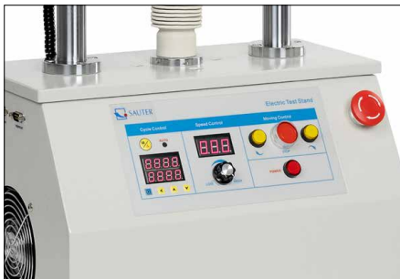
Premium-Bedienpanel - Digitale Geschwindigkeitsanzeige - Digitale Wiederholungsfunktion