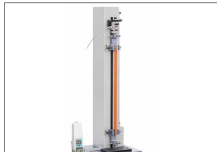
Un grand nombre de possibilités d'utilisation grâce à la course grande