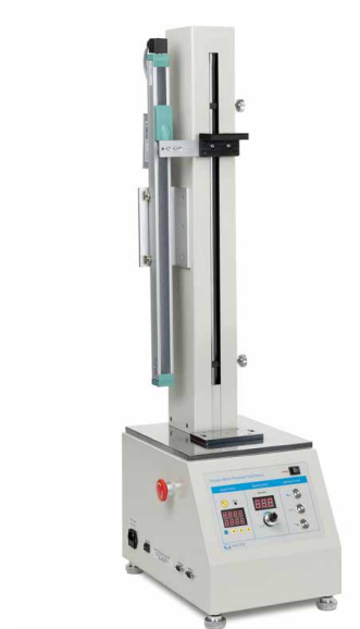
Banc d'essai motorisé incl. appareil de mesure de longueur LD