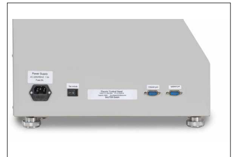
Interface pour le transfert de données du dynamomètre SAUTER FH et pour la commande du banc d'essai avec le logiciel SAUTER AFH