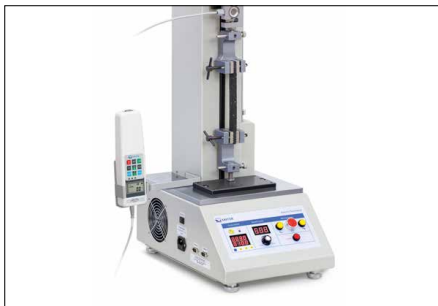
Possibilités de fixation solides et flexibles de nombreux accessoires et pinces de la gamme SAUTER, voir Accessoires