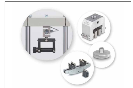
Solide und flexible Befestigungsmöglichkeiten durch eine hohe Anzahl an Klemmen und Zubehörfteilen aus dem SAUTER Sortiment, siehe Zubehör