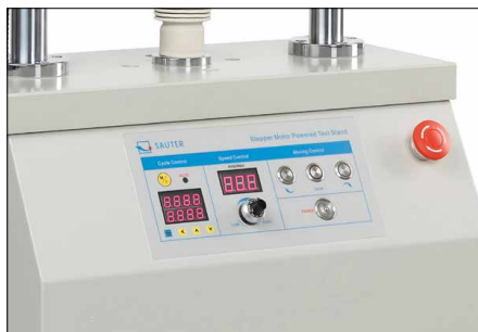
Tableau de commande haute gamme - Indication digital de la vitesse permet de lire directement la vitesse de mouvement - Fonction digital de répétition pour des essais de charge permanente