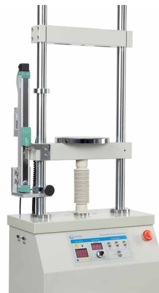
Banco di prova motorizzato incl. sistema di misurazione della lunghezza LD